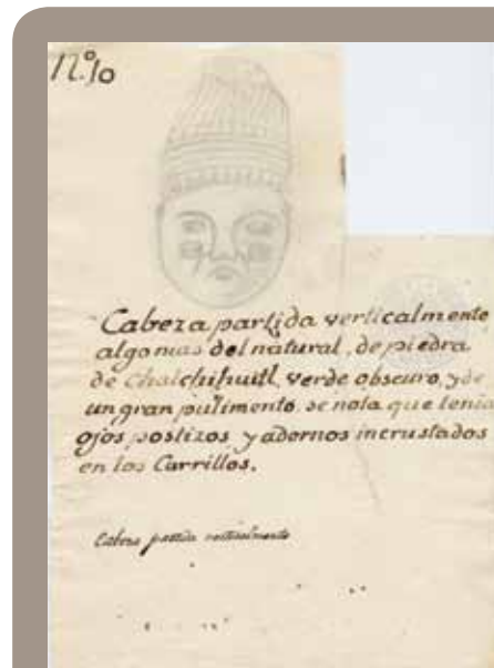
Máscara de Chalchihuitlicue. Colección de Guillermo Dupaix.

Sabemos igualmente que el hombre prehispánico visitaba con asiduidad centros ceremoniales en ruinas, y que exploraba ávidamente edificios y plazas cuyas formas se adivinaban bajo la vegetación. En estos peculiares escenarios, marcados por el silencio y la desolación, llevaba a cabo excavaciones premeditadas en busca de imágenes, sepulcros y toda suerte de depósitos rituales. Tales operaciones no perseguían el lucro, sino la recuperación de objetos singulares, preciosos, sacros y, por tanto, dignos de ser coleccionados. En efecto, estas reliquias, al igual que las descubiertas accidentalmente y las transferidas de generación en generación, fueron valoradas por su elevada calidad de materias primas y de manufactura. Pero, ante todo, su supuesta naturaleza divina decidió a los nuevos propietarios a portarlas como amuletos o a reinarhumarlas como ofrendas dedicatorias y funerarias en el interior de sus templos y palacios. Al parecer, no sólo las piezas completas tenían ese carácter, sino que su poder se extendía a los fragmentos. De no ser así, es difícil concebir