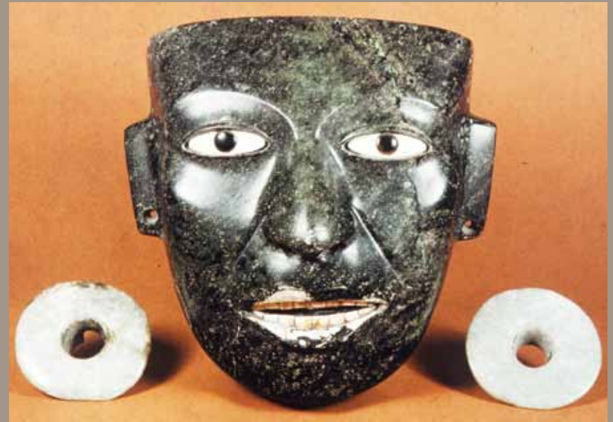
Máscara estilo teotihuacano proveniente del Templo Mayor de Tenochtitlan. Museo del Templo Mayor.

Esta particular mirada hacia los vestigios arqueológicos se trastoca con la Conquista española y el inicio del periodo colonial. La expedición de Juan de Grijalba en 1518 es el signo más temprano de los nuevos vientos. Diversos documentos nos narran cómo sus hombres profanaron sepulturas indígenas en la Isla de Sacrificios y en las márgenes del río Tonalá, recuperando para sí collares de oro y recipientes de travertino. De esta forma, los recién llegados se percataron de que los metales no sólo podían ser obtenidos como botín de guerra o en calidad de “rescate” a cambio de cuentas de vidrio. Así lo entendió también Andrés Figueroa, capitán español que en tierra mixe cambió los arcabuces por las palas. De acuerdo con Bernal Díaz del Castillo, se dedicó con éxito a violar las tumbas de los caciques locales y cosechó el equivalente de cinco mil pesos de oro.