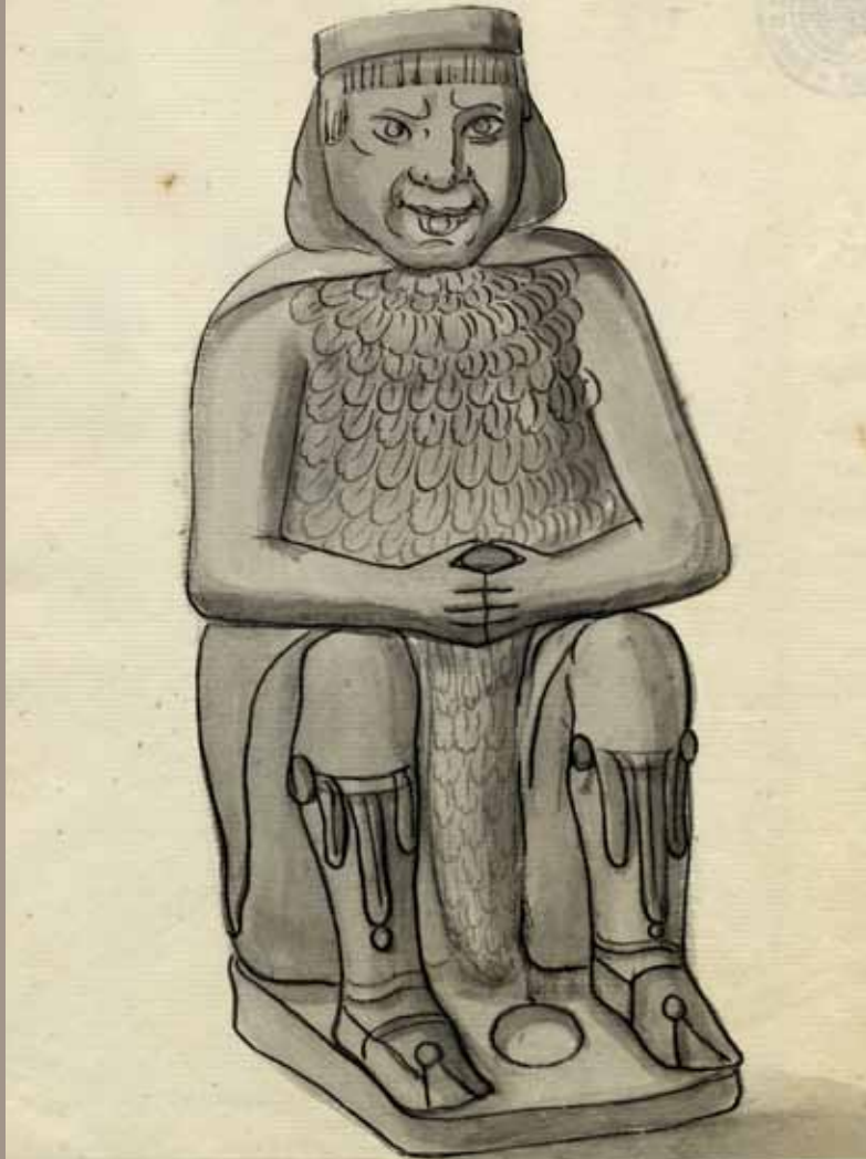
“El indio triste”. Colección de la Real Academia de Pintura de San Carlos. Tomada de Descripción de monumentos antiguos mexicanos . BNAH.

fue reevaluado por motivos científicos y políticos. Entonces se realizaron reconocimientos de sitios virtualmente desconocidos como Xochicalco y Cantona, relaciones acerca de